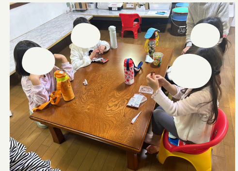
みんなでおやつパーティーをしながら楽しく食べています